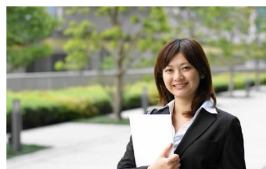
企業で働いた経験

地域に暮らす多様な人々とバランスを持って付き合うと同時に、地域独自の課題やニーズを理解している。