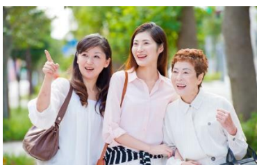
地域コミュニティの核

日々消費者として暮らしており、消費者として、商品やサービスに対して、プロの消費者の厳しい目を持っている。