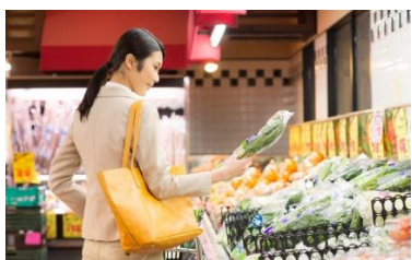
消費活動の中心者

当社のキャストネットワークは、働きたい意欲の高い女性を中心とした方々が登録しています。当社のサービスで常に連絡を取りあっている信頼性の高いキャストの中から、ご依頼内容に適したキャストを経験とスキルに応じて選定し、お仕事の依頼から契約まで当社の独自のシステムとノウハウで管理・運営いたします。